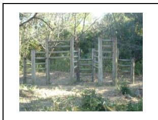
⑪丸太を横向きで渡ります