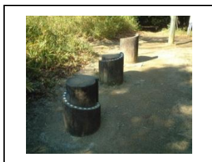
②台の中央に立ち、膝を曲げずに両手を低い目盛りに付けます