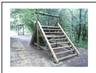
⑩ロープにつかまりながら丸太の上をこえます