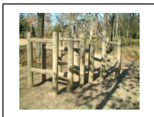
⑦ 丸太の枠をくぐります