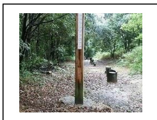
①片手を真上に伸ばし、ジャンプしたときの高さを測ります