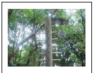
⑫上部の鐘をならします