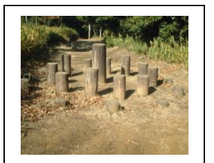
④ 跳石のように跳びます