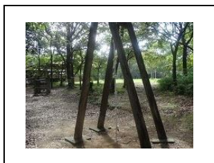
⑥ ロープをのぼります