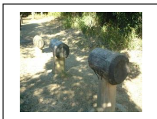
③馬跳びの要領で順番に跳びます