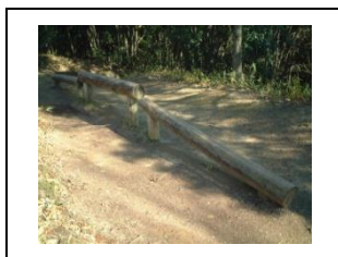
⑤ 丸太の上を歩きます